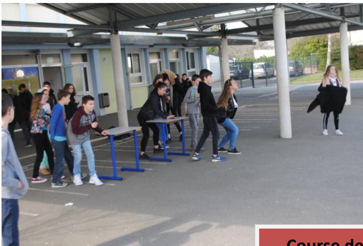
Course de relais