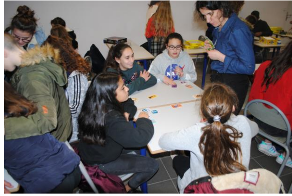
Des jeux pour tous les goûts