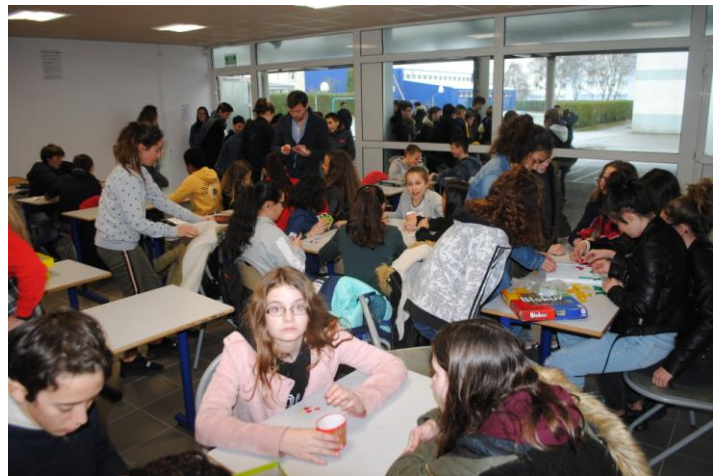
Merci à tous les élèves qui ont joué le jeu lors de cette semaine des mathématiques !