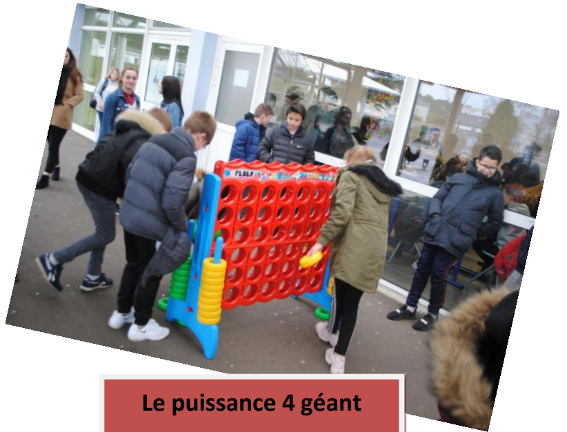
Le puissance 4 géant