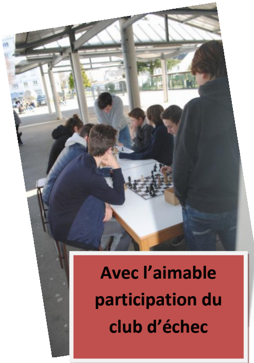
Avec l'aimable participation du club d'échec